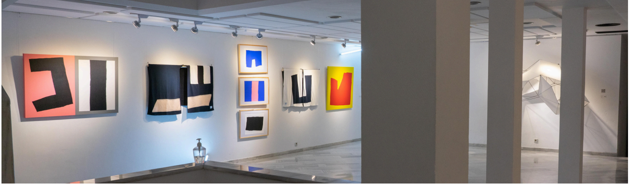
Sala Atrio White Lab