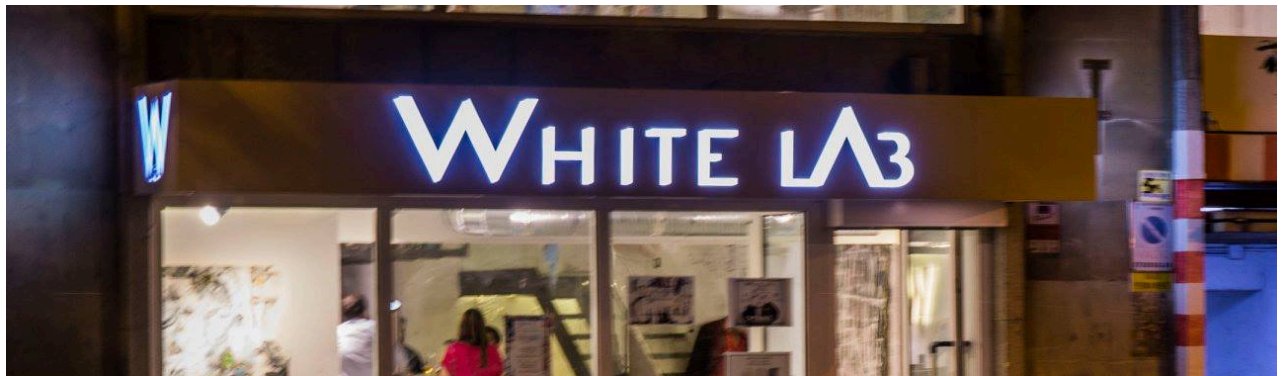
Imagen de la Antigua Sede de White Lab