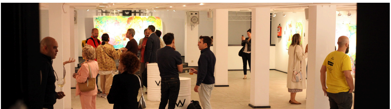
Inauguración Exposición Septiembre - Octubre 2025 - Sala Stage

La exposición se completa con una programación de actividades vinculadas, entre las que destaca la celebración del 11 de junio , un momento de encuentro entre artistas, profesionales y público. Un gesto coherente con la propia naturaleza del espacio, donde el intercambio y la presencia compartida forman parte esencial del proyecto.